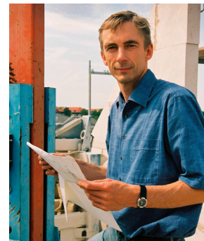
Tätig für Bauherren, Käufer und Eigentümer seit 2003.

— Am Bau Beteiligte ... achten uns, wenn sie an Qualität interessiert sind. Wir arbeiten frei von Interessen Dritter - für Sie.